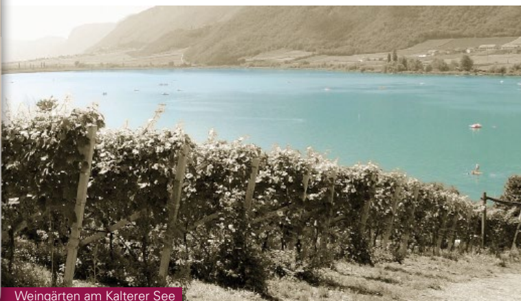
Weingärten am Kalterer See

Bei Abnahme von 45 Flaschen erhalten Sie zusätzlich 15 Flaschen ohne Berechnung!